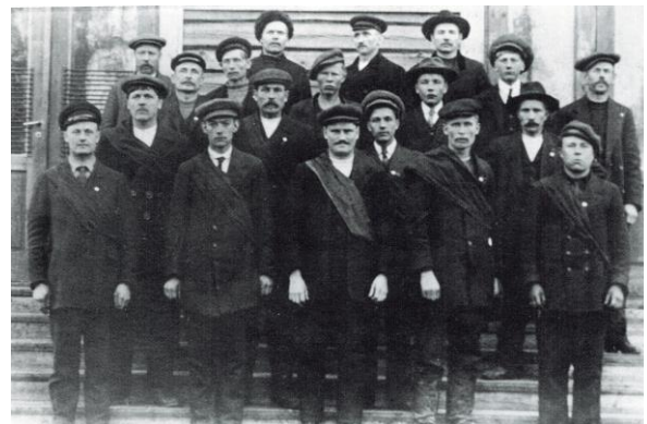
Marraskuun suurlakon lakkovahdit Mäntässä.

Venäjän tsaari syöstiin vallasta maaliskuussa 1917, mistä seurasi järjestys- ja hallintovallan romahtaminen ja auktoriteettiaseman menettäminen. Työväenliike käytti tilaisuutta hyväksi ja esitti lakkojen tukemana uusia vaatimuksia. Nyt mm. Mäntässä saavutettiin 8-tuntinen työpäivä. Järjestysvallan romahtamisen seurauksena työväenliikkeen keskuudessa alettiin perustaa järjestyskaarteja. Erityisesti Vilppulassa syntyi monia kaarteja. Osassa kaarteista harjoiteltiin sotilaallista toimintaa jo ennen marraskuuta. Mäntässä kaarti toimi maltillisemmin lähinnä lakkovahteina. Myös porvariston puolella alettiin perustaa ”vapaapalokuntia”, joista sitten muodostui suojeluskuntia. Mäntässä ja Vilppulassa ei ollut voimakkaita suojeluskuntia ennen sisällissotaa. Lähin merkittävä suojeluskunta oli Keuruulla. 1,2,3