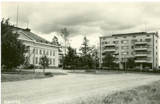
Mäntän klubi ja Pilvilinna. Pilvilinna toimi myös huoltokoulutuskeskuksen majoitustilana

Kesällä 1941 Mänttään sijoitetun Huoltokoulutuskeskuksen esikunta oli Mäntän Klubilla. Yksiköitä oli kouluilla ja esim. yksityisessä autokorjaamossa. Koulutuskeskuksessa oli Autokomppania, Kuormasto- ja eläinlääkintäkomppania ja kenttäsairaalahenkilökunnan koulutusta. Huoltokoulutuskeskus siirrettiin Lahteen syksyllä 1942. 8