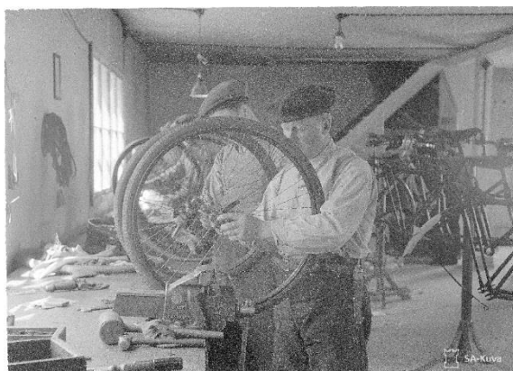
Kuormastovarikko, pyörien korjaus

Talvisodan aikana Vilppulaan perustettiin kuormastovarikko. Siellä huollettiin ja varastoitiin rekiä, kärriä, kenttäreittimiä, suksia ja polkupyöriä. Toiminta jatkui huhtikuulle 1945, jolloin se lakkautettiin valvontakomission määräyksestä. 2