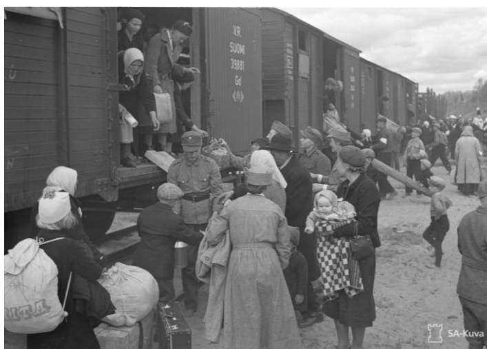
Evakkoja Vilppulassa 23.6.1941

Sodan alettua rautatiepaikkakunta Vilppulaan tuotiin suuri määrä evakkoja. Heitä majoitettiin aluksi kouluille, mistä sitten ohjattiin eteenpäin naapurikuntiinkin. Kuorevedelle ja Jämsään sijoitettavia evakkoja tuotiin Mäntän kautta. Toinen evakkoaalto oli jatkosodan syttyessä ja kolmas jatkosodan päättyessä. Vilppulan kuntaan jäi siirtoväkeä noin 1600 henkeä. Mänttään ei asuntopulan vuoksi sijoitettu merkittävästi siirtoväkeä, mutta työhönoton kautta tännekin jäi karjalaisia. 1,2,7