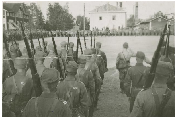
Jatkosodan lähtöparaati Mäntän torilla 20.6.1941