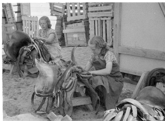
Kuormastovarikko, satuloiden puhdistus